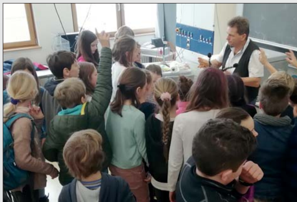
„Reptilien und Amphibien“-Veranstaltung für die 6. Jgst.

Der Förderverein legt Wert auf Projekte, die auf soziales Engagement, Kreativität, Begegnung und Miteinander sowie individuelle Förderung ausgerichtet sind. Er finanziert sich ausschließlich aus Mitgliedsbeiträgen und Spenden.