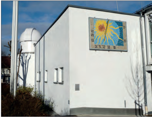
Unterstützung der Sternwarte und des P-Seminars „Sonnenuhr“