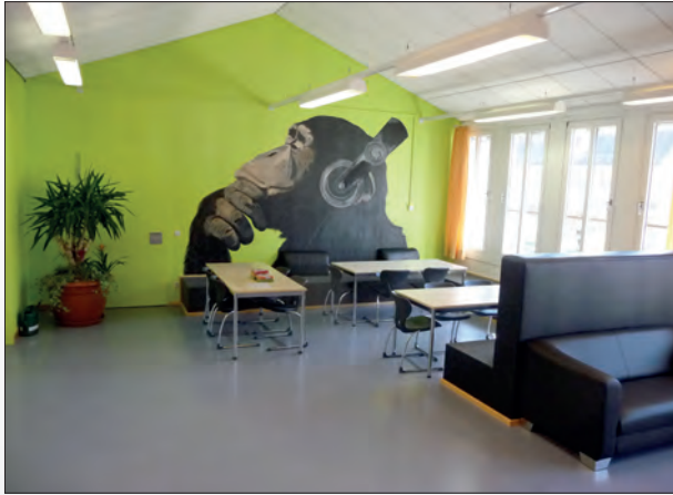
Unterstützung bei der Gestaltung des Oberstufenzimmers